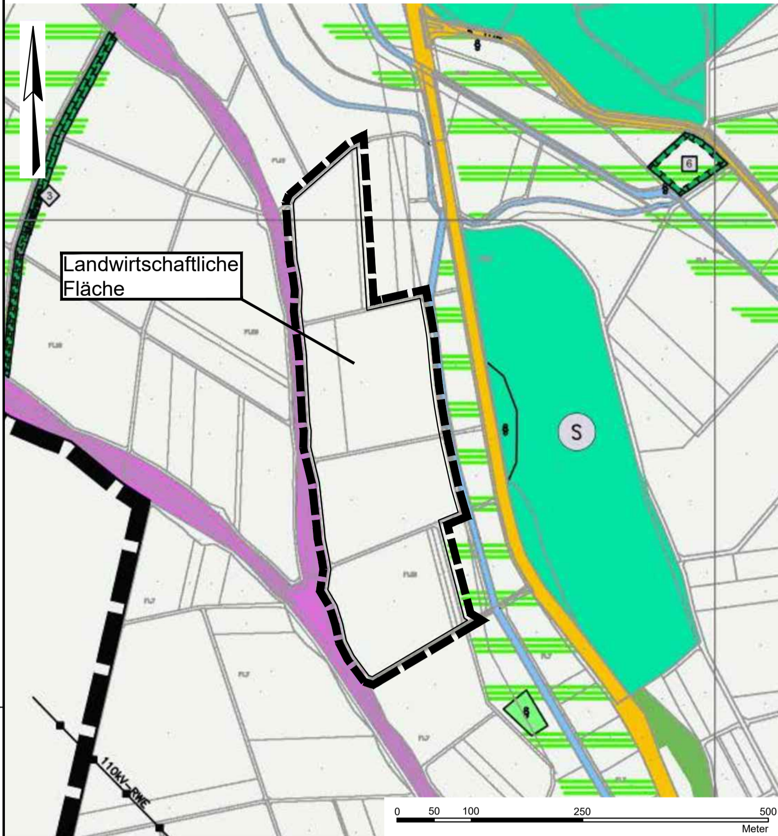
Darstellung der Flächen durch Änderung des rechtswirksamen Flächennutzungsplanes